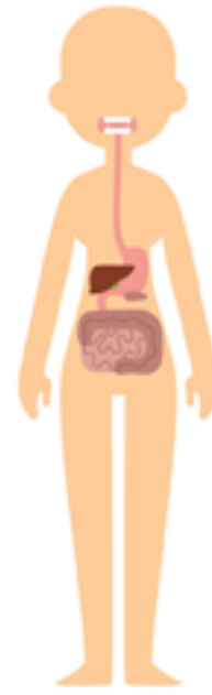
Digestive System Sistema Digestivo