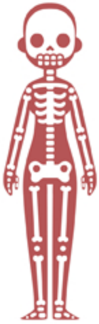
Skeletal System Sistema Esquelético

El cuerpo humano tiene 10 sistemas principales (y otros de menor importancia). Estos sistemas mantienen al cuerpo trabajando de forma sincronizada, y cualquier cambio puede alterar su función. Por ejemplo, si el sistema cardiovascular (corazón y vasos sanguíneos) presenta problemas, éste podría hacer que los demás sistemas comiencen a fallar.