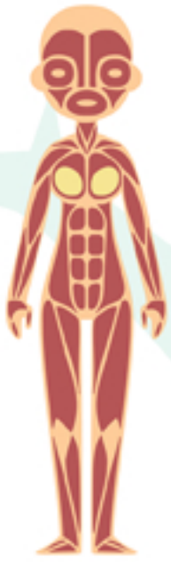
Muscular System Sistema Muscular