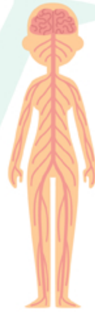
Nervous System Sistema Nervioso